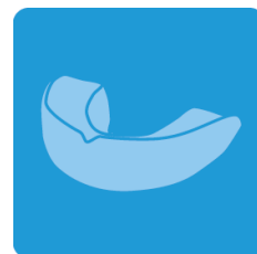
マウスガード等に