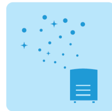
次亜塩素酸水対応 噴霧器で空間除菌に