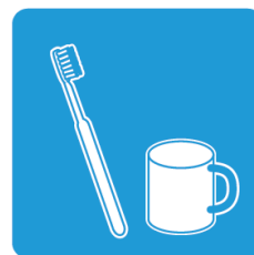
歯ブラシやTBI時の ツールに