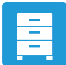
キャビネット等に