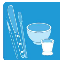
スパチュラやツール類に