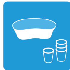
往診時のツール類に