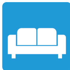
待合室のソファー等に