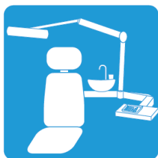
ユニットまわりに